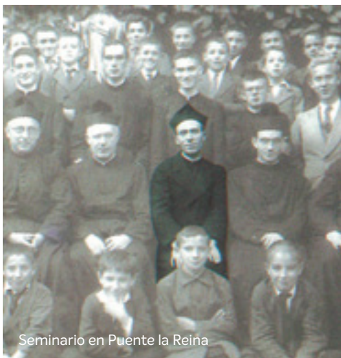
Seminario en Puente la Reina

El Seminario de Puente vivía momentos de esperanza porque tenía muchos seminaristas, pero había una extrema pobreza por falta de medios.