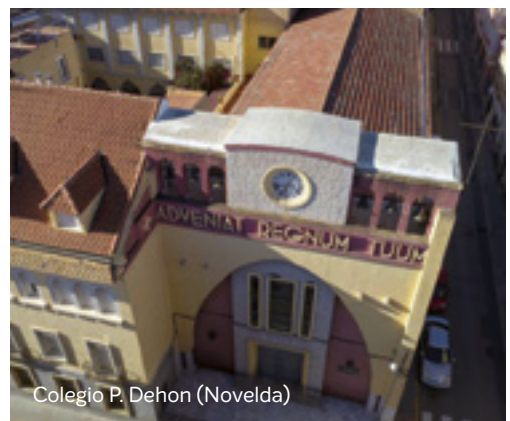
Colegio P. Dehon (Novelda)