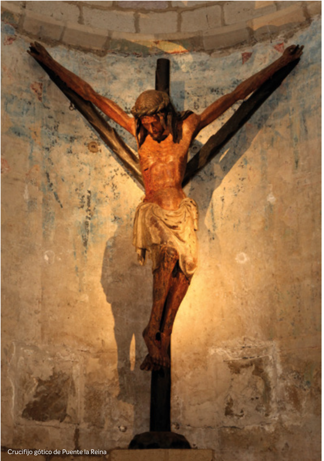
Crucifijo gótico de Puente la Reina