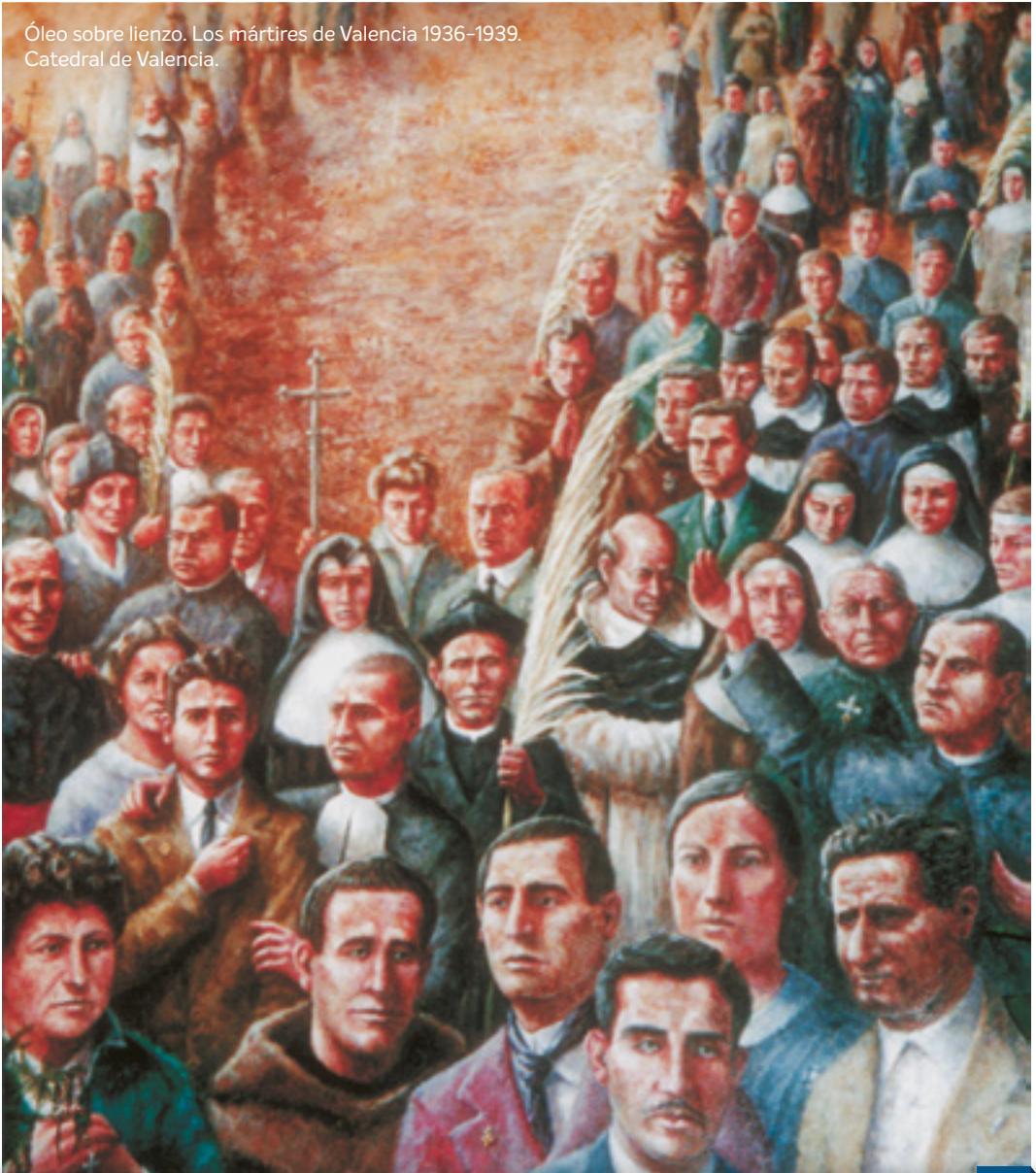
Óleo sobre lienzo. Los mártires de Valencia 1936-1939. Catedral de Valencia.

en la capilla. La celebración de sus Misas siempre tenía el peligro de cansar a sus pequeños e inquietos monaguillos, por lo que, en muchas ocasiones, como el mismo San Felipe Neri, les invitaba a que le dejaran solo con su Señor, en ese diálogo mudo de adoración y de amor, propio de los que profundamente viven el misterio de Amor encerrado en la Eucaristía.