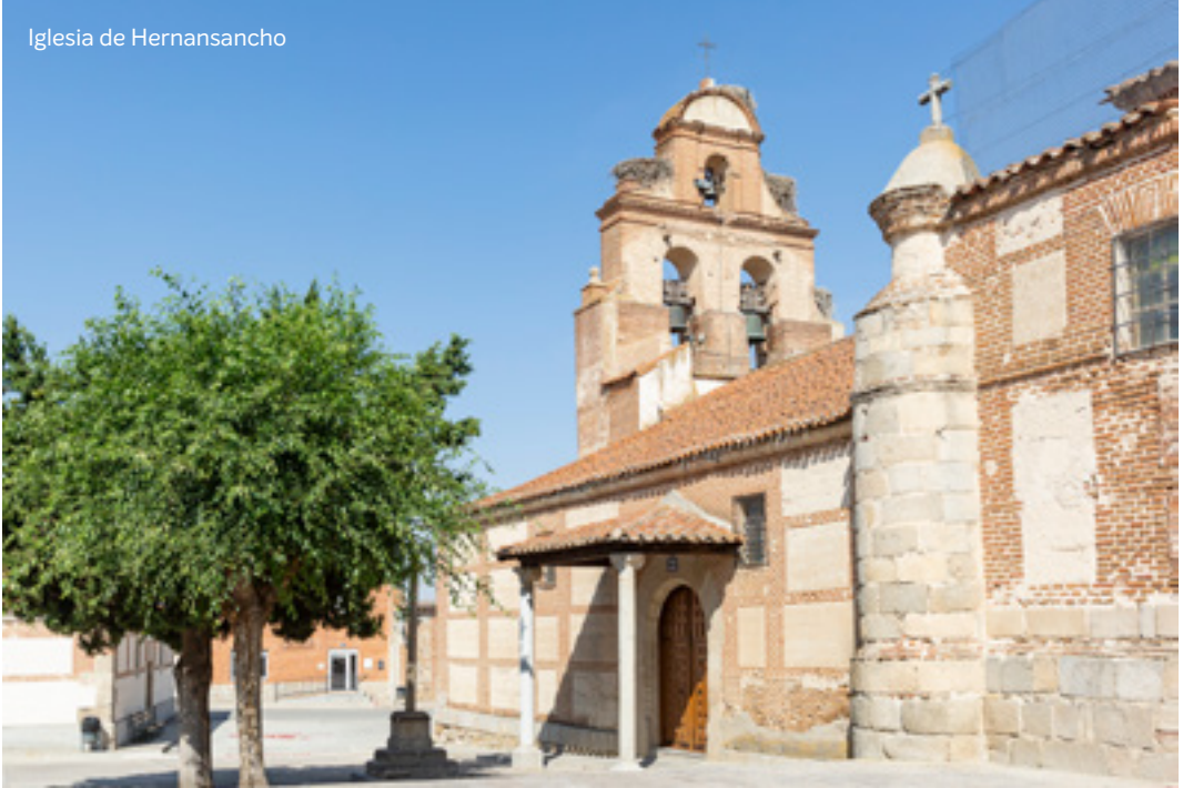
Iglesia de Hernansancho

Santísimo, de mortificación corporal, de predicación, catequesis y encuentros personales, de la sencilla humildad de tantos y tantos curas de pueblo que calladamente han servido, educado y acompañado a sus fieles.