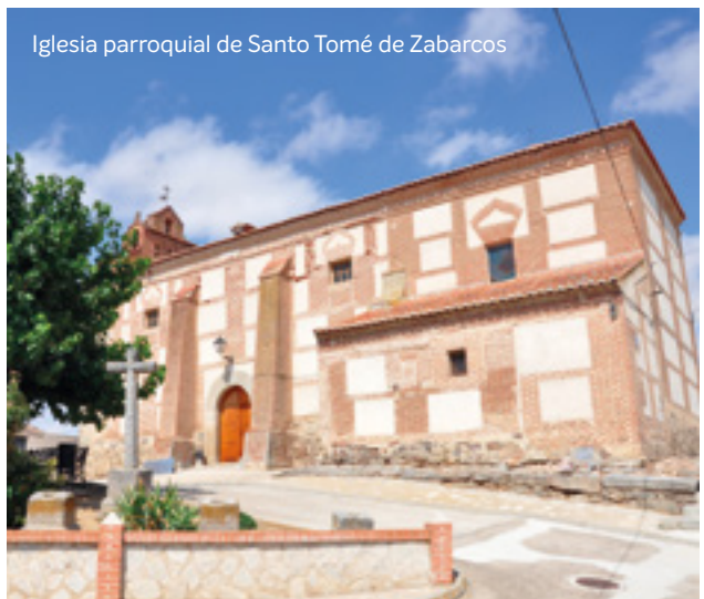
Iglesia parroquial de Santo Tomás de Zabarcos