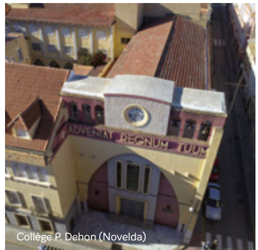
Collège P. Dehon (Novelda)