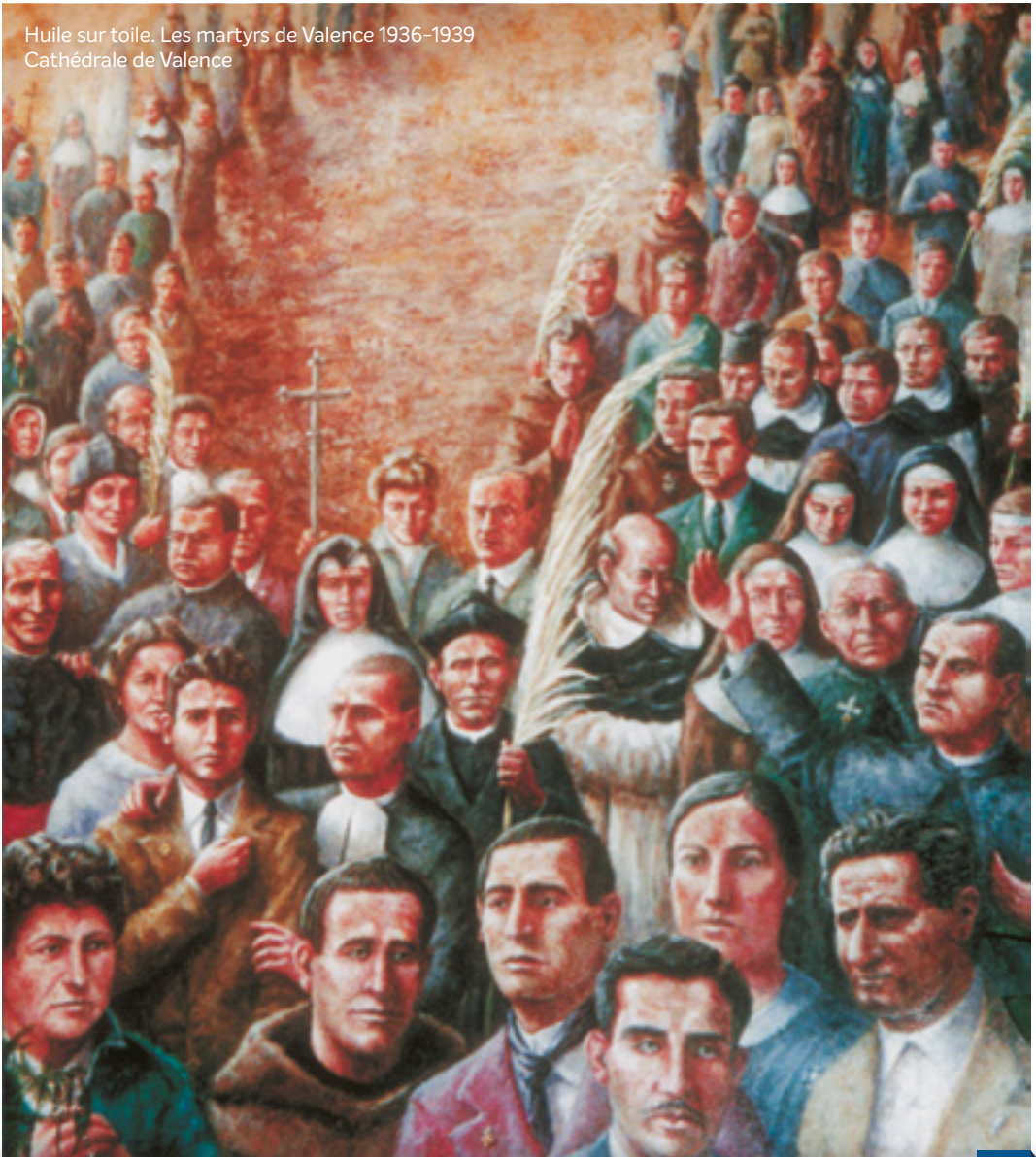
Huile sur toile. Les martyrs de Valence 1936-1939 Cathédrale de Valence