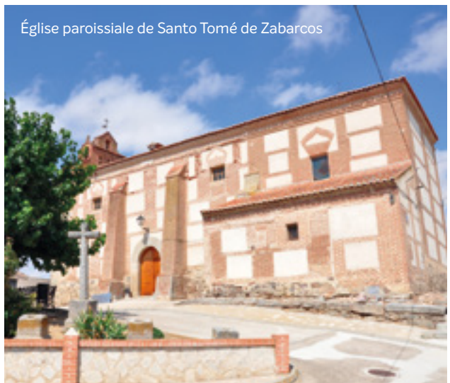
Église paroissiale de Santo Tomé de Zabarcos