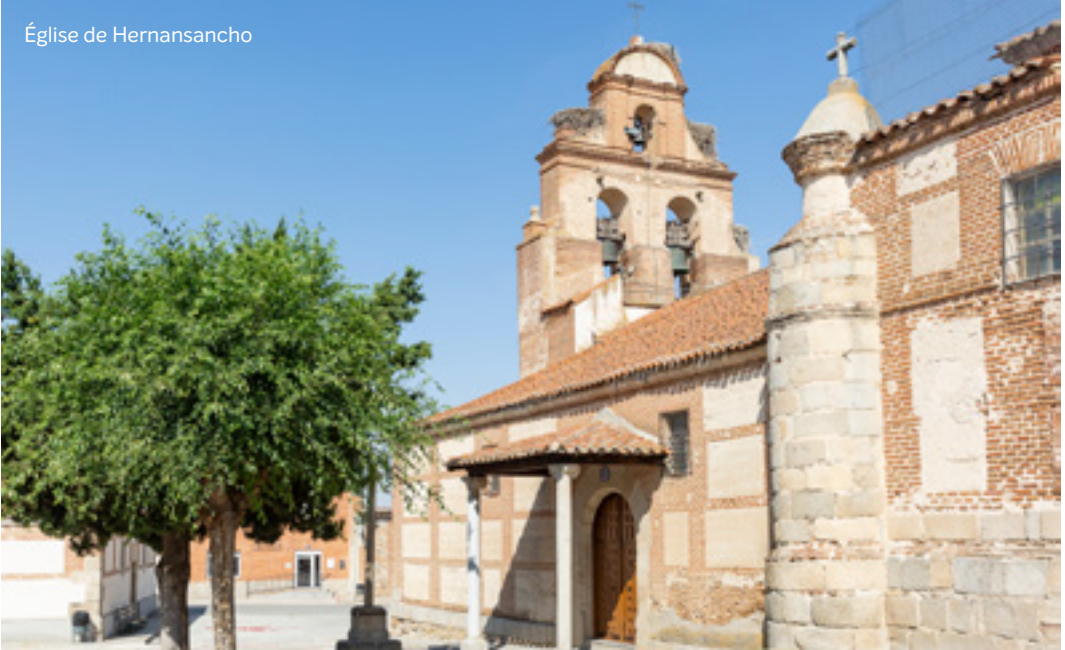
Église de Hernansancho

devant le Saint Sacrement. Il pratiquait la mortification corporelle. Il s'adonnait à la prédication, à la catéchèse, aux rencontres des personnes. Il vivait de cette humilité simple dont ont témoigné tant de prêtres de campagne qui avec ferveur ont servi, éduqué e accompagné leurs fidèles.