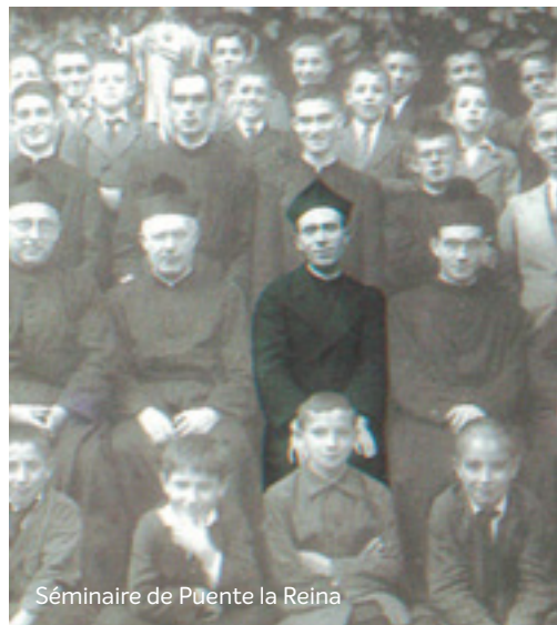
Séminaire de Puente la Reina