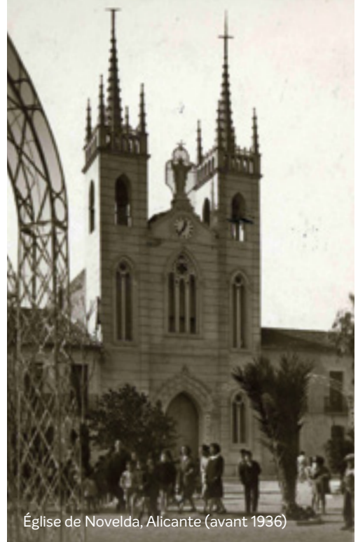
Église de Novelda, Alicante (avant 1936)

la géographie de l'Espagne. C'était là quelques-unes des choses qu'il racontait aux séminaristes de Puente la Reina, quand il rentrait à la maison après ces voyages à la recherche de ressources et de vocations.