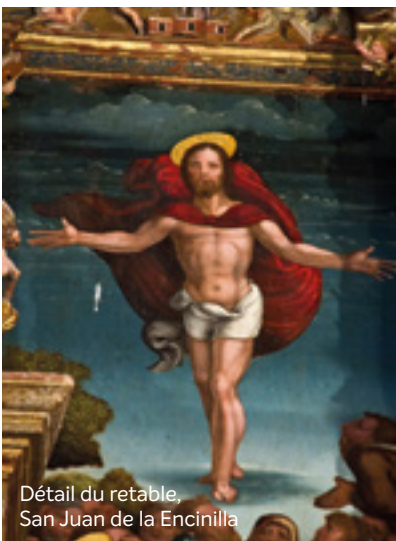
Détail du retable, San Juan de la Encinilla